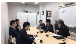
大阪会場の様子です。

大阪会場 ：参加費 1,000 円 河原事務所Cafe スペース (大阪市北区梅田1丁目1-3 大阪駅前第3ビル2F) 7月4日(水)、8月6日(月)