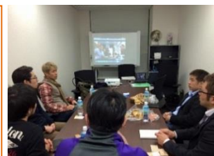
東京会場の様子です。

東京会場 ：参加費 1,000 円 (株)PAN.Labo 東京営業所 (東京都港区虎ノ門 2-7-5 BUREX 虎ノ門会議室)、 7月23日(月)、8月27日(月)