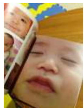
1ページどアップの写真は特に気に入っています！