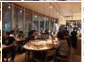
ルパンコティディアン

ブロータハイムに始まり、様々なお店を回りました。なかなか1日にこれだけ多くのパン屋さんに行くということはありません。世田谷・三軒茶屋・表参道という地域柄か、対面形式のお店が多かったこと。日曜に訪問したという点から、休日限定パンを出しているお店が多かったこと。そのほかにも振り返ると特徴や取り組みが見えてきて、とても有意義な一日になりました。快く撮影させていただき、ありがとうございました。(喜多 泰友)