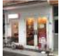
「大橋会館」近くにもパン屋さん「TOLO」