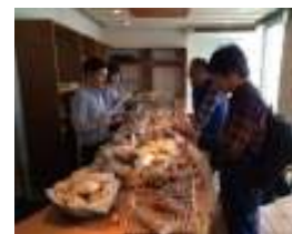
シニフィアンシニフィエ