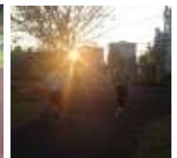
体の芯を鍛えるための腹筋？そして光の射す方へ！