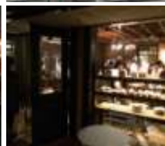
ブレッドワークス