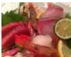
新鮮なお刺身盛り合わせ！