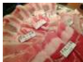
豚しゃぶ美味しかったです！