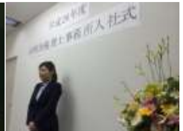
力強く宣言してくれました。