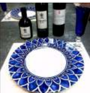
豪華プレゼントです(^-^)

では料理の提案ということで、和食職人やパティシエも参加されます。今までにない新しいパンの講習会になりそうです。また、参加者全員にグラス、プレート、ランチョンマットがプレゼントされるそうですよ(左写真)。当日はイベント会場にて、関西の人気ブーランジェリーやメーカー様による様々なブースも出店する予定です。とてもにぎやかな講習会になりそうですね。日時は2014年7月15日(火)10:00~16:00、場所はイッセエスタ大阪エスタ館5F、費用は10,000円です。お申込みは河原事務所でも受け付けています。メールフォーム( http://www.bakery-no1.com/contact.html )に「パンと和のマリアージュ」と書いてお申込みいただければと思います。(喜多 泰友)