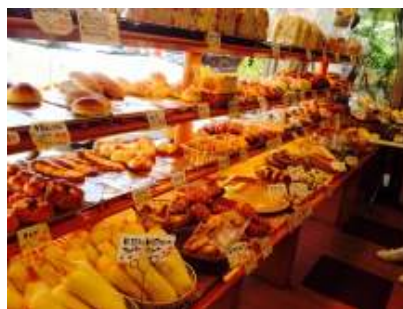
美味しそうなパンがたくさん！