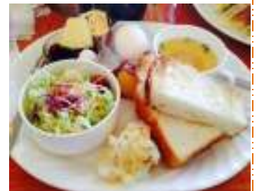
モーニング美味しかったです！