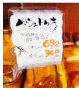
奥様手書きの可愛いポップ