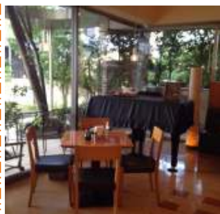
パン屋さんにピアノが！？