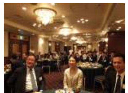
懇親会では皆さん和やかに情報交換されています(^^)