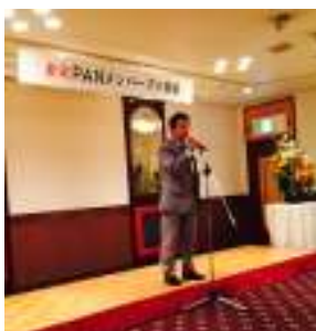
PANメンバーズの新たな動きが?!