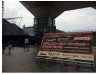
ビックサイト到着！気合入ります！

8/1(月)～8/3(水)東京ビックサイトで行われた「P&B Japan展示会」に出展！