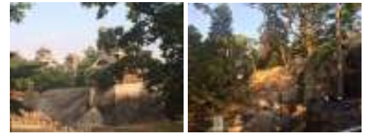
熊本のシンボル、熊本城にも大きな被害が・・・。