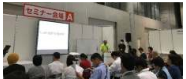
セミナーもたくさんの方にご覧いただくことができました！