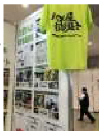
緑のTシャツが目印です！