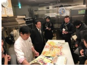
販促物の多さと量が圧倒的！