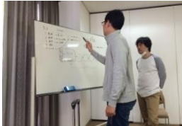
熱い議論が交わされる！

2日目は、会議室を借り終日缶詰で今年度の振り返りから次年度の計画へ。毎年恒例次年度のキャッチフレーズが「P・P・A・P～P」に決定！ふざけているようですが結構まじめ！フレームが決まることで、数値計画・行動計画が組みやすくなり、三人で、とことん話し合うことができました。夜は神戸牛に舌鼓！食も満足な3日間。間違いなくこの合宿が事務所力を高めていると思います。