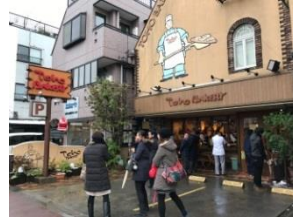
三鷹市トーホーベーカリー