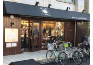
世田谷区ブーランジェリースドウ