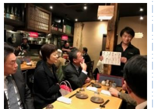
東京都中央区銀座 ごち惣家