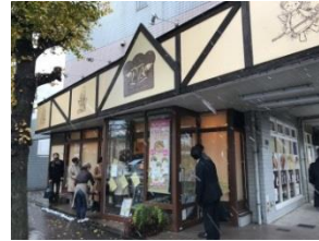
東京都国立市プチ・アンジュ