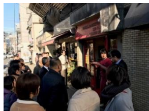
東京都港区セイジアサクラ