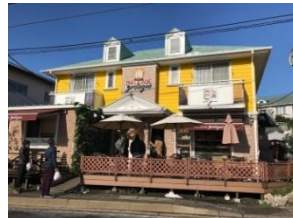
横浜市青葉区プロログ