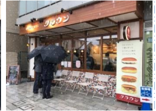
小金井市クラウンベーカリー