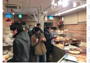
世田谷区サンセリテ北の小麦