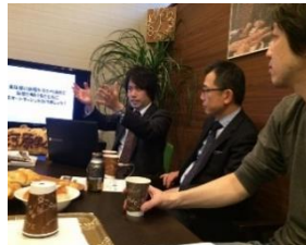
大阪会場の様子です。

大阪会場 ：参加費 1,000 円 河原事務所Cafe スペース (大阪市北区梅田1丁目1-3 大阪駅前第3ビル2F) 2月5日(月)、3月5日(月)