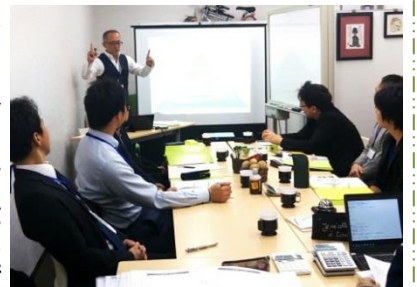
マーケティングの勉強会・ワクワク実践塾