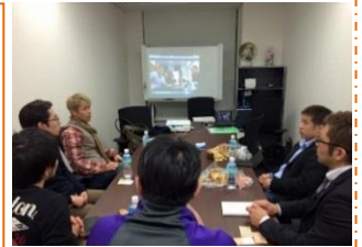
東京会場の様子です。

東京会場 ：参加費 1,000 円 (株)PAN.Labo 東京営業所 (東京都港区虎ノ門2-7-5 BUREX 虎ノ門会議室)、 2月26日(月)、3月26日(月)