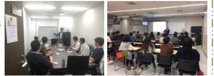
講師を招いて座談会