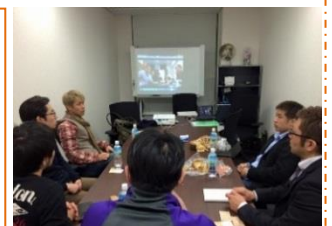
東京会場の様子です。

東京会場 ：参加費 1,000 円 (株)PAN.Labo 東京営業所 (東京都港区虎ノ門2-7-5 BUREX 虎ノ門会議室) 2月26日(月)、3月26日(月)