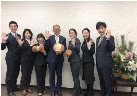
カンパニーの語源もカンパニオです。

【河原事務所の今年度のテーマは『カンパニオ』です】 昨年の年度計画において「酉年は熟した実がピークを迎える年」と表現しました。そしてその表現どおり事務所も7人揃ったメンバーで一年を過ごすことができ、「PPAP-P」のキャッチフレーズの元、念頭に掲げた10項目のチャレンジも、ほぼ8割達成することができました。本当にありがとうございます。そんな喜びをみんなで分かち合いたいと10月に全員で行った