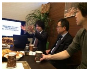
大阪会場の様子です。

大阪会場 ：参加費 1,000 円 河原事務所Cafe スペース (大阪市北区梅田1丁目1-3 大阪駅前第3ビル2F) 2月5日(月)、3月5日(月)