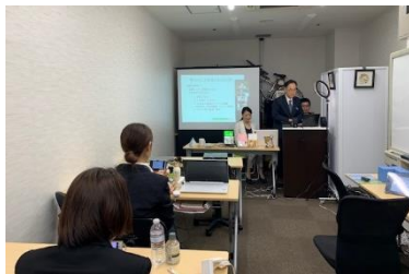
会場組みは、演台を使つての発表！